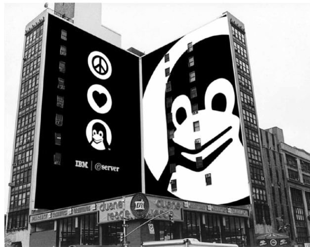
Linux. El sistema operativo es el mascarón de proa del movimiento pro software libre

En Uruguay varias dependencias estatales comenzaron a usar SL. Entre las pioneras se destacan las ex juntas departamentales de San José y Paysandú, oficinas de la Comuna Canaria, la Intendencia de Montevideo, el Poder Judicial y el Palacio Legislativo. Por resolución, la agencia oficial para el Desarrollo del Gobierno de Gestión Electrónica recomienda el uso de formatos abiertos y